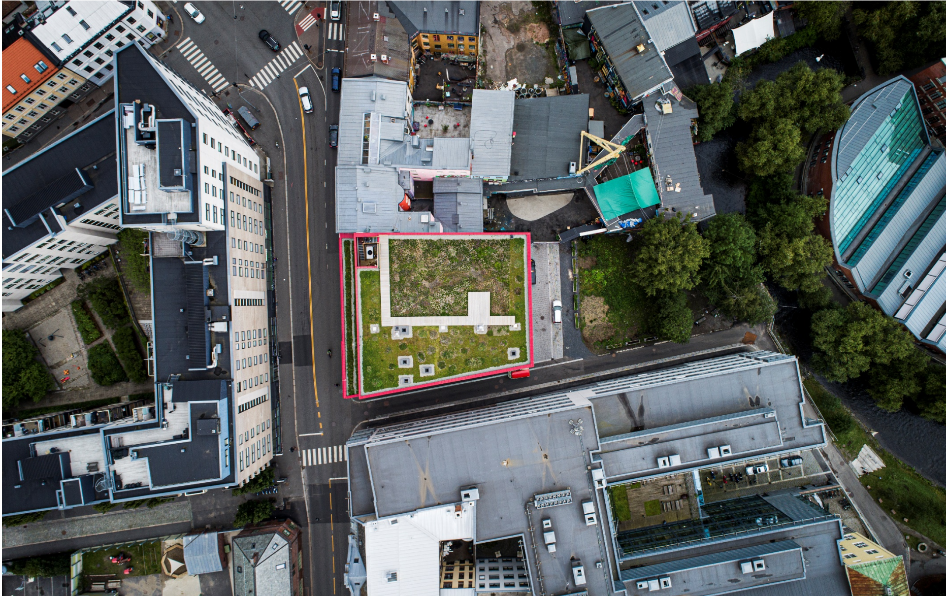
Figur 2 viser eksempel på åpen vegetert overvannshåndtering i tett by. På taket til Vega Scene fremtidens 20 års regn før det renner ut i Akerselva.